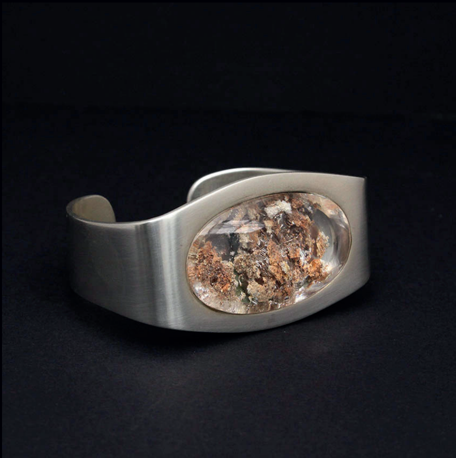
Bracelete Areia | Prata 950 + Quartzo c/ inclusões*