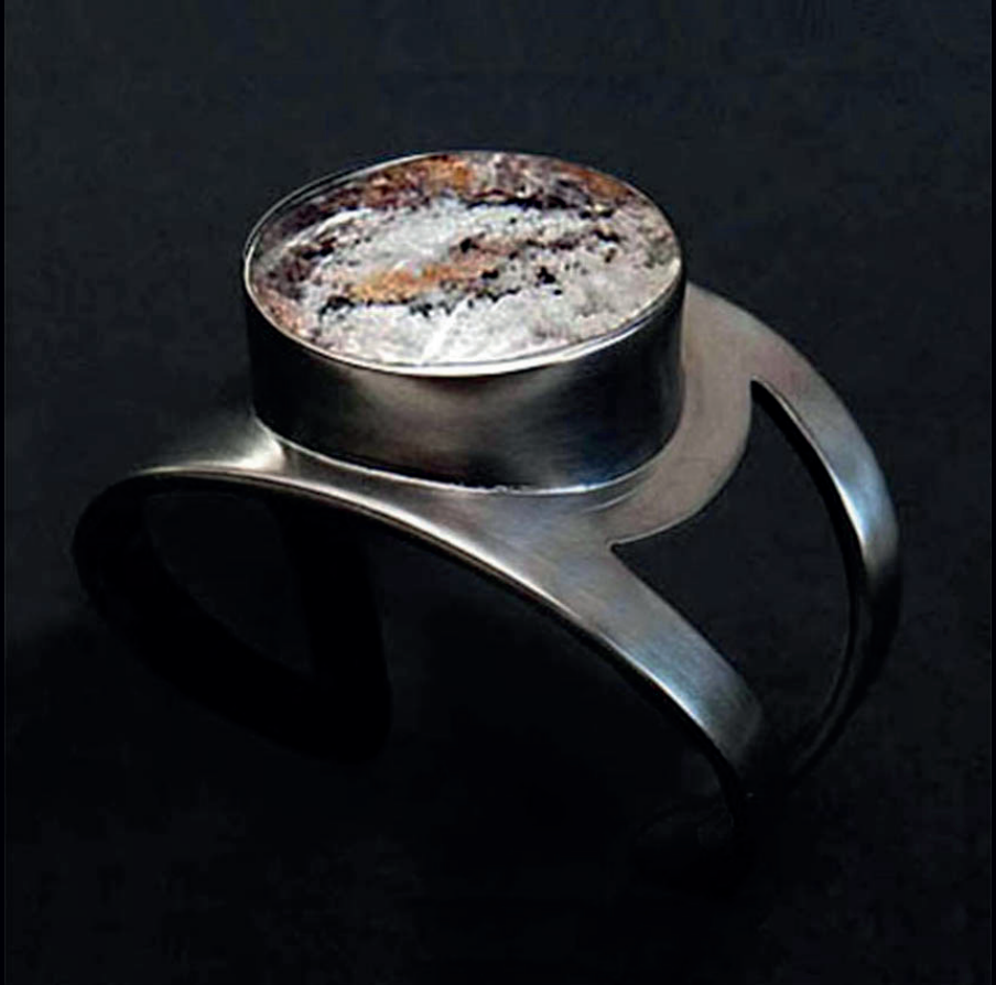
Bracelete Terrário | Prata 950 + Quartzo c/ inclusões*