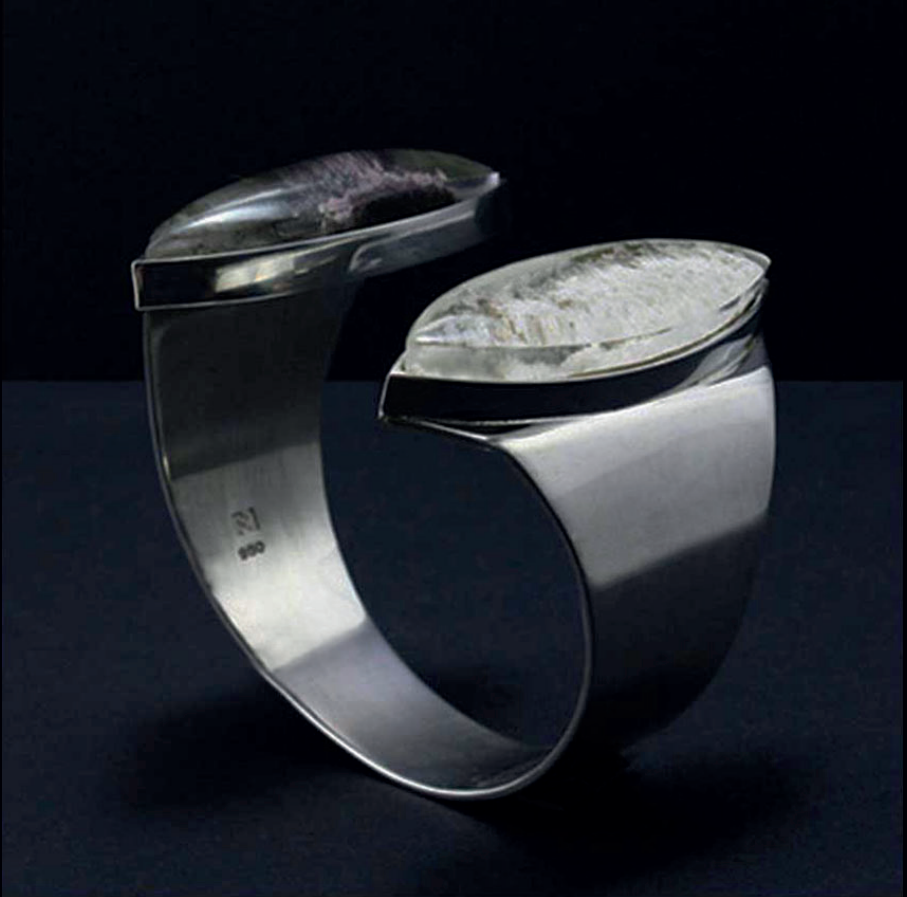
Bracelete 2 Sementes | Prata 950 + Quartzo c/ inclusões*